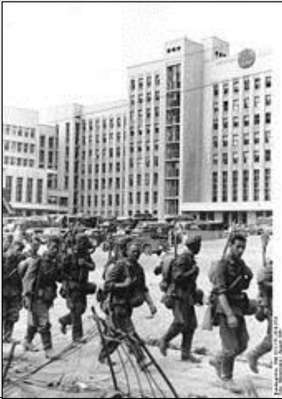
מינסק שנות ה-40