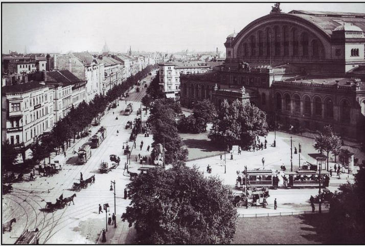
ברלין שנות ה-20, מקור לא ידוע