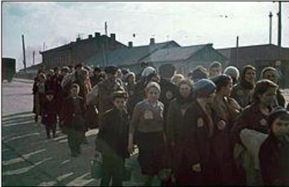
גטו מינסק שנות ה-40