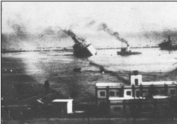
אוניית המעפילים "פאטריה" טובעת