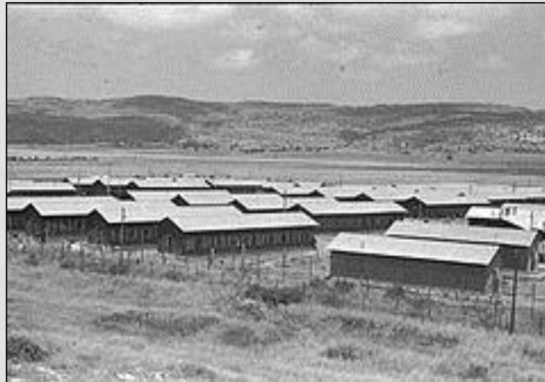
מחנה המעפילים עתלית שנות ה-40