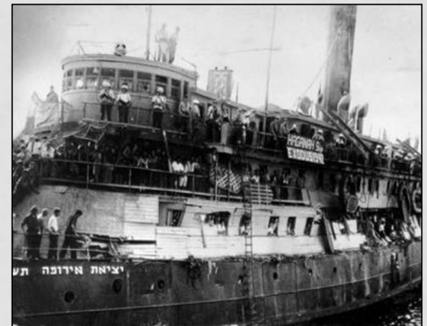
אונית פאטריה