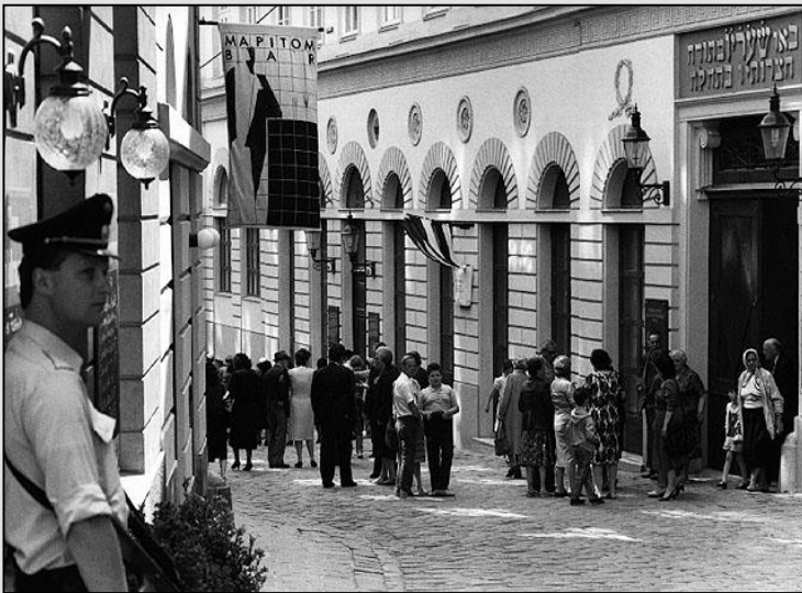
וינה, אוסטריה

לפי המידע באתר עולה כי פרידריך עזריאל נולד בווינה אוסטריה.