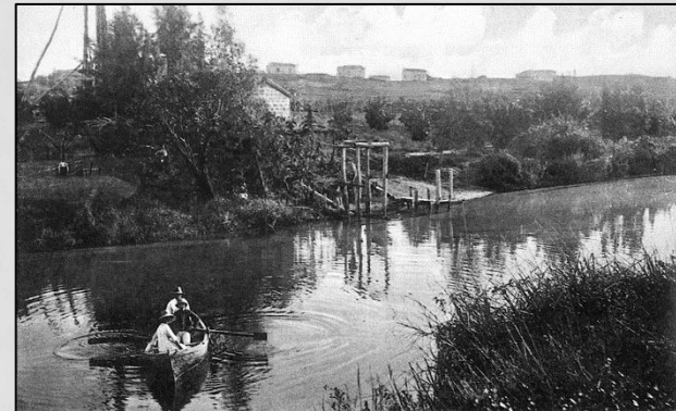
קיבוץ חפציבה שנות ה-40.

משה ואשר הגיעו מבודפשט והיו באותה חברת נוער בקיבוץ חפציבה