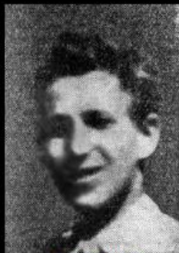
בן 18 בנופלו