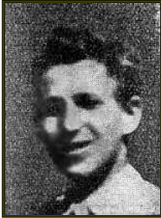
בן 18 בנפלו

נולד בהונגריה בתר"צ, 1930 התגורר בחפציבה שרת בפלמ"ח - חטיבת יפתח יחידה: הגדוד הראשון - "העמק" נפל בקרב בג' בסיון תש"ח, 10/6/1948 במלחמת העצמאות מקום נפילה: קיבוץ גזר באזור מרכז הארץ והשפלה מקום קבורה: גזר