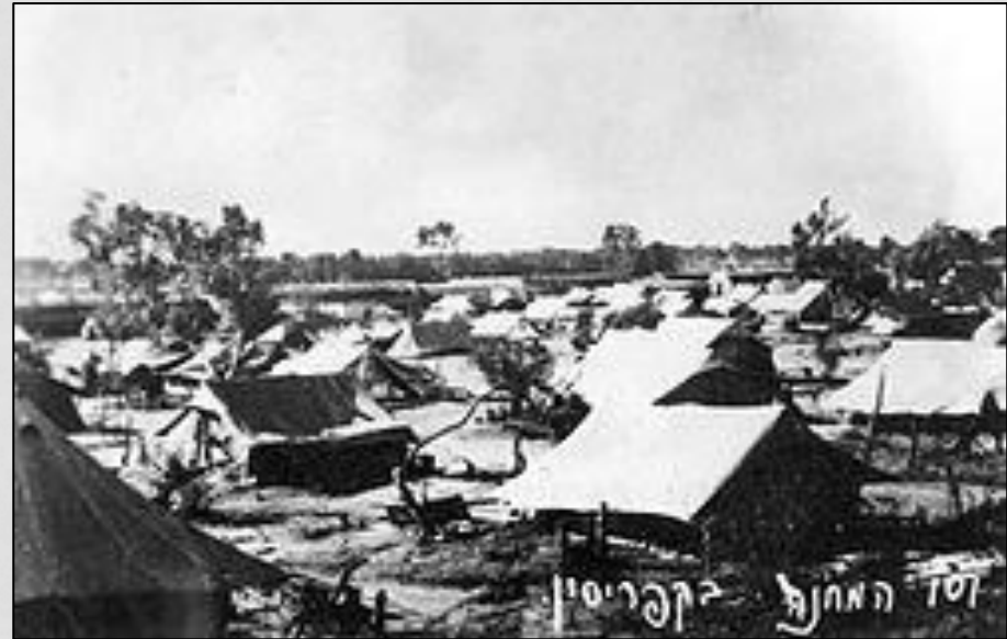
מחנה המעצר קפריסין