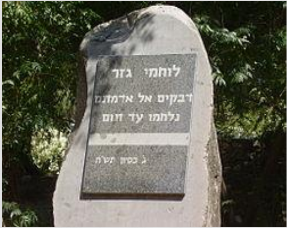
בית העלמין בגזר.