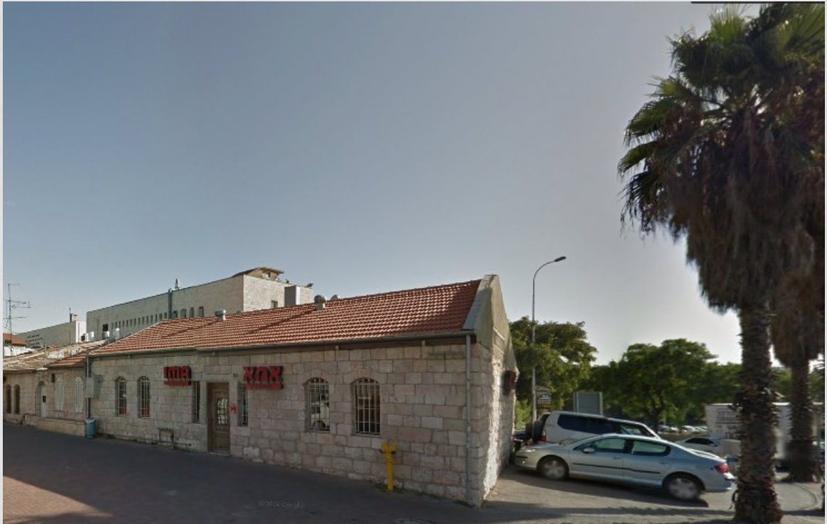
בית משפחת אסקיו, היום מסעדת אמא, רחוב אגריפס 1 ירושלים.

עודם שחורם (מ.בוטצ' שייג" ועד למירודי הגיטאות). הערב ב"5:50 במה"ס למל הרצאה זרובבל; מדטיסים בועדת התרבות זערב בקופה.