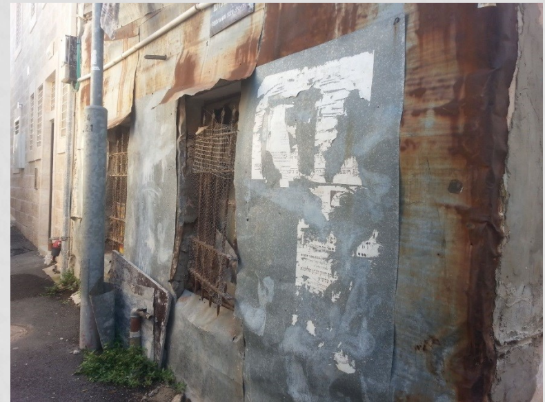
שכונת שבת צדק

מופיע: אסקיו אברהם בן מנחם, שכונת שבת צדק